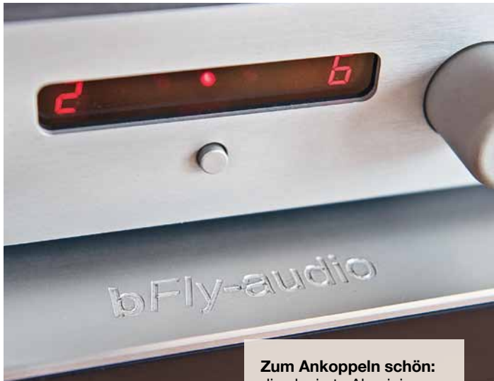
Zum Ankoppeln schön: die eloxierte Aluminium- Oberfläche der Base Two

hier ein Duo zu bilden, das unbedingt zusammen „spielen“ will – ein echtes Highlight im Zubehörschub, zumal wenn man den wirklich attraktiven Preis bedenkt.